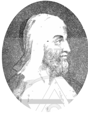
Ο ΠΛΟΥΤΑΡΧΟΣ W. Ridley εχάραξε, 1826 (Βιβλιοθήκη Δημ. Γούναρη)

Ολόκληρη η δοθείσα στον «Παρνασσό» διάλεξη.